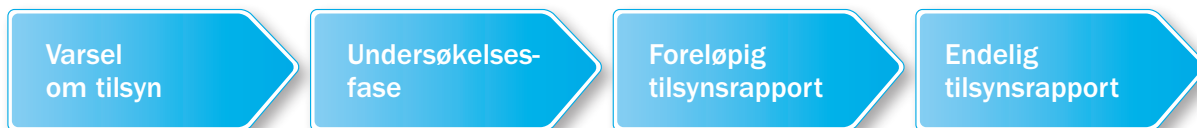
Tilsyn der det avdekkes lovbrudd

Tema og skoler det skal føres tilsyn med, velges ut fra risikovurderinger (sannsynlighet for at lovkravene ikke oppfylles og eventuelle konsekvenser). Risikovurderingene skal sikre at tilsynsressursene brukes der hvor behovet for tilsyn er størst.